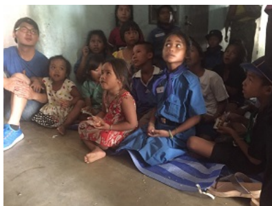
專注的佻族孩子們