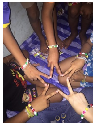
信靠耶穌祂已復活得勝

使我想起每次每天的義診結束，也都馬上有就診病人的病症分類、比例報告，為了進一步做衛教的準備，是針對百姓的真正需要。同樣的，這大學生的問卷如同「心靈義診」處方，為著針對大學生的需要跟進。